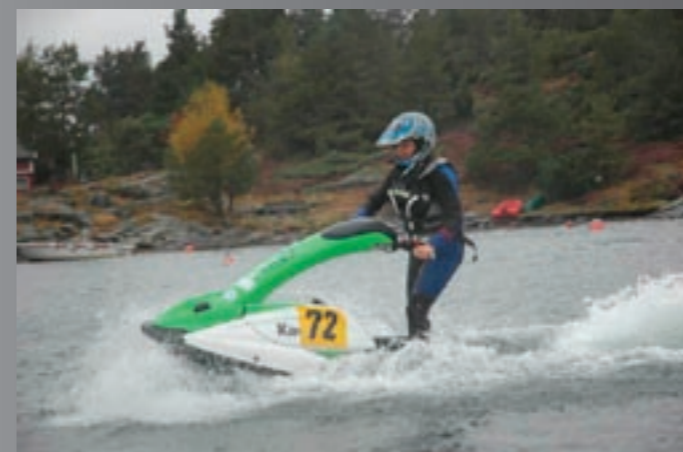
Bratt'n IL besøker NMF Kristiansand og prøver vannjet.

Ambassadørklubbene vil dette året samarbeide om å arrangere to motorcamper. Dette skal være camper for klubbens medlemmer, men også en lærearena for personer som ønsker å involvere seg i integreringsarbeidet. Ambassadørklubbene ønsker å invitere trenere, aktivitetsledere og tillitsvalgte fra flere klubber på campene for å vise hvilke muligheter klubbene har til å starte med integrering selv.