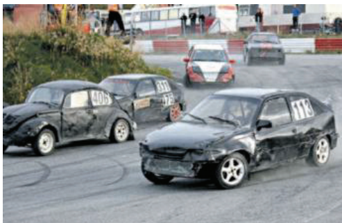
UTEN RALLYCROSS: Årets løpshelger på Åsegarden og på Moan har opplevd meget låber deltakelse i klasse rallycross nasjonal. Illustrasjonsfoto

Hun understreker likevel at det beste vil være framtidige arrangementer som tar med seg den fulle bredden av den lokale motorsporten.