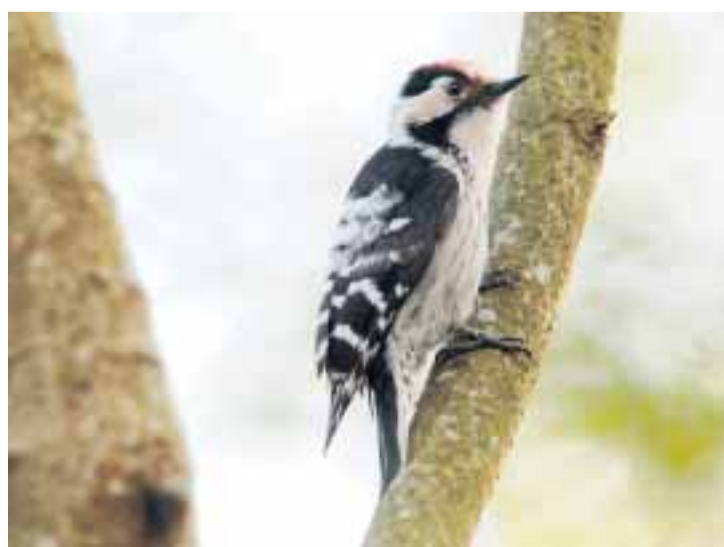
TRIVES VED VEI: Dvergspetten kan mange steder hekke nært inntil tungt trafikkerte veier og nær bebyggelse, skriver Norsk institutt for naturforskning.

■ Norsk institutt for naturforskning er et nasjonalt og internasjonalt kompetansesenter innen naturforskning. Kompetansen utøves gjennom forskning, overvåking, utredningsarbeid og konsekvensutredninger, heter det på deres nettsider.