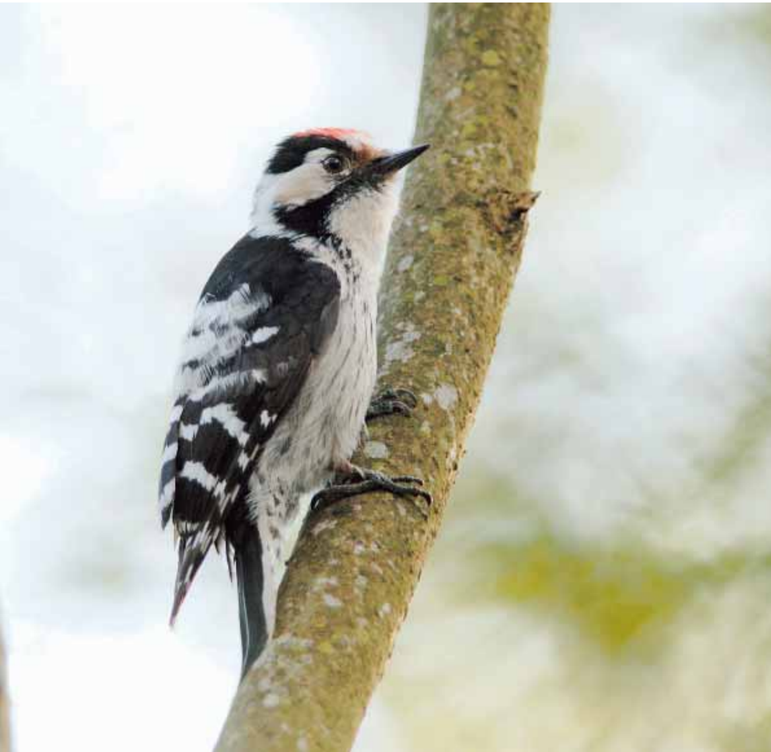
og finnes på norsk rødliste over truede arter.