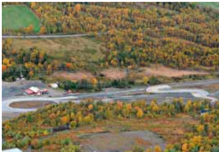
HER LEVER DVERGSPETTEN: Dette er dvergspettens område. Midt i bildet ligger motorsportsanlegget.