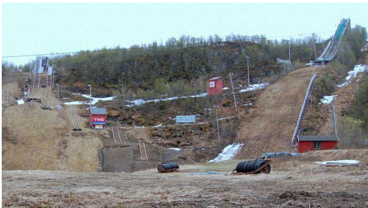
TINER: Kveldteigen i Skaret. 24. mai 2010.

Nå kommer pengene til rehabilitering av hoppbakken i Kveldteigen.